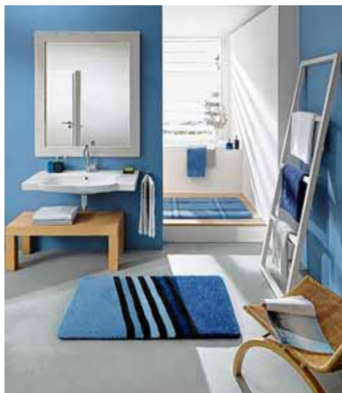
Ein angenehmes Blau an den Wänden und bei den Teppichen, schon präsentiert sich das Badezimmer neu.