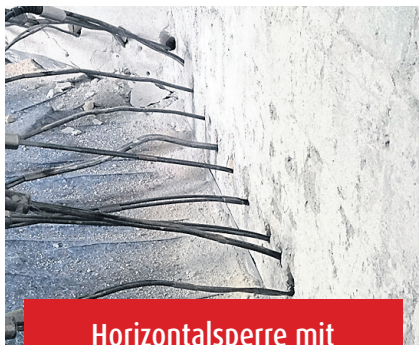
Horizontalsperre mit Spezialparaffin und Creme