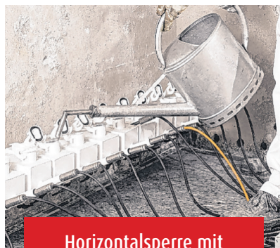
Horizontalsperre mit Spezialparaffin