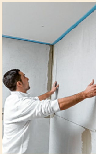
Dem Schimmel vorbeugen mit der ISOTEC-Klimaplatte.