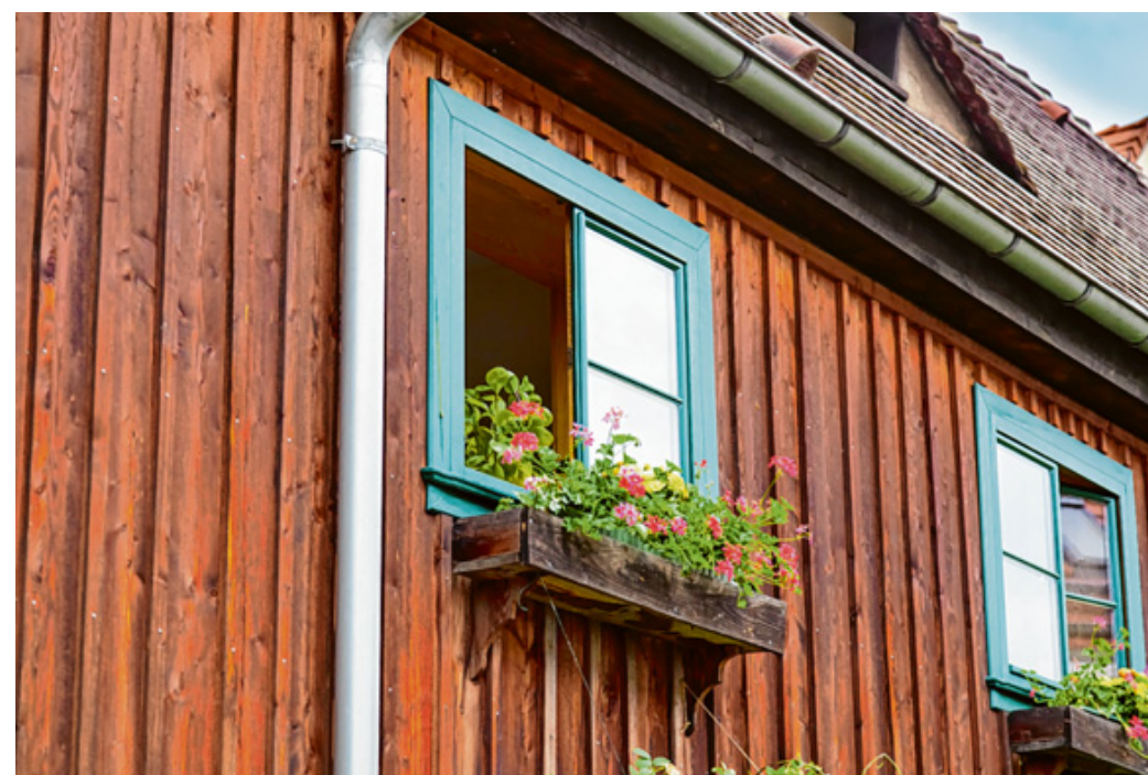
Mittlerweile ist das keine Seltenheit mehr: Farbige Fensterrahmen aus Holz oder Kunststoff setzen gekonnt optische Akzente am Haus.

sich der Eigentümer für seine vier Wände wünscht, es ist sehr viel möglich. Dabei bleibt es ganz dem Geschmack des Hauseigentümers überlassen, ob er Fenster aus Kunststoff, Holz oder Metall oder auch Kombinationen daraus für sein Bauprojekt verwendet. Oberster Grundsatz: Erlaubt ist, was gefällt. Sei es nun in der Grundfarbe des ausgewählten Fensterrahmenmaterials oder zum Beispiel bei schicken Holzfenstern in lackierter beziehungsweise bei Kunststofffenstern in folierter Form: Kreativen Modernisierern mit ausgefallenen Ideen stehen heutzutage dank fortschrittlicher Fertigungstechniken „alle Fenster offen“. pm/pilz